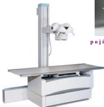
Combi Elevator-2 (elevační stůl)