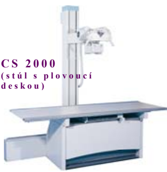
CS 2000 (stůl s plovoucí deskou)