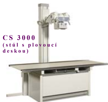
CS 3000 (stůl s plovoucí deskou)