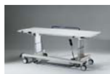
pojízdní elevační stůl PROGNOST

Informace o nářadí na samostatných katalogových listech