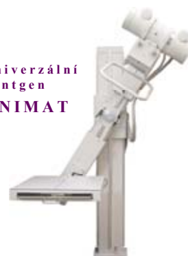
univerzální rentgen UNIMAT